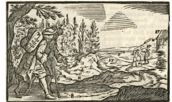
J. A. Comenius, Orbis Pictus

Darüber hinaus werden Jubiläen von weiteren 18 Mährischen Brüdern in den Jahren 2023, 2024, 2025 und andere Themen zur Geschichte der Brüdergemeine in Erinnerung gerufen.